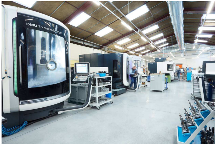
Atelier de l'entreprise.